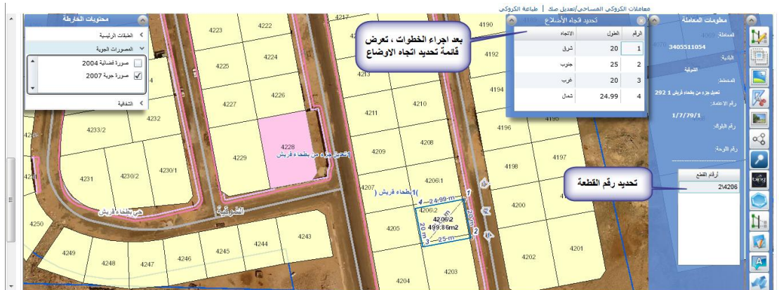
( الشكل ٤,١,٣ )