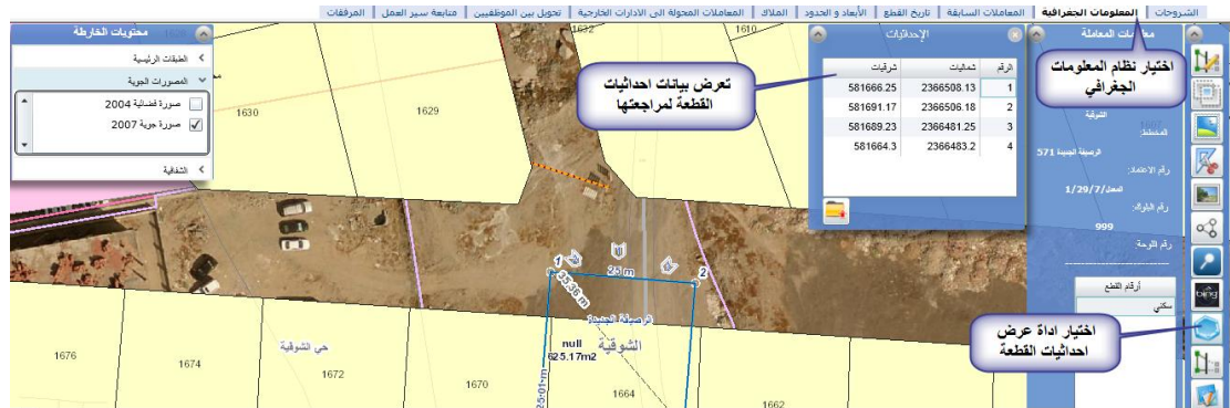
( الشكل ٤,١,١,١ )

٤,١,١,٣ اختيار اداة الاحداثيات ليعرض قالب التداخل