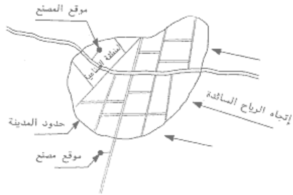
موقع المصنع بالنسبة للمدينة وإتجاه الرياح